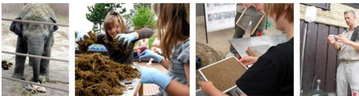
Tværfagligt arbejde om dyr, energiomsætning og billedkunst i Zoologisk Have