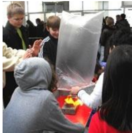
Afprøvning af massefylden for varm luft