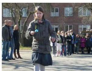
Løb med forårsæg til påske

Det fremgår ret tydeligt, at trinmålene er forholdsvis vage og abstrakte og reelt nødvendiggør spørgsmål af den type, der her er formuleret. Disse spørgsmål er til gengæld alt andet end vage, men stiller til omvendt store krav til lærerne, fordi alle indholdsvalg reelt er overladt til den enkelte lærer eller fagteamet. Trinmålene skal med andre ord udmøntes personligt for overhovedet at kunne omsættes. Fælles Mål træffer ikke valgene for én – tværtimod.