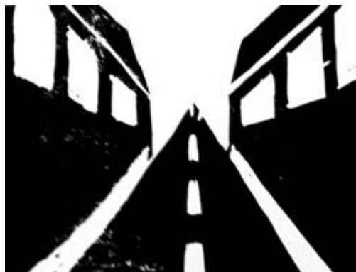
Barndommens gade som linoleumsgrafik. Del af fællesarbejde om digtet, sangen og Tove Ditlevsen på hele skolen i 2010.

Planlægning bliver således et fundament for undervisningen på Byens Skole og omdrejningspunkt for den evaluering, der til stadighed pågår i løbet af et skoleår.