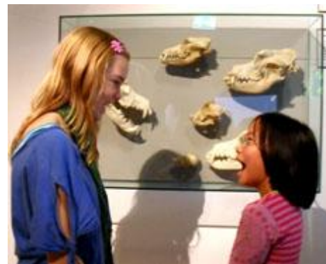
Skeletter og levende børn på Zoologisk Museum

Cirkelmodellen er i udgangspunktet almen, og den kan anvendes både med og uden et eksPLICIT læremiddelfokus. Læremiddeldiskussionen viser sig imidlertid uundgåeligt, når årsplanen skal konkretiseres og undervisningsplanen skal realiseres. Der er derfor indsat nogle begreber i parentes i modellens forskellige faser, begreber, der siger noget om, hvilken status læremidler har undervejs i den bevægelse, som modellen beskriver. Først sker der i forbindelse med omsætningen af Falles Mål til egne årsplaner en redidaktisering af de anvendte læremidler, som anskues både i lyset af de fælles mål for faget og ens egne undervisningsmål. Dernæst organiseres disse læremidler i undervisningsplanen og bruges i selve undervisningen. Efter undervisningens gennemførelse er vurderingen af de anvendte læremidler et uomgængeligt element i evalueringen af undervisningen, og man er her i realiteten i gang med at redidaktisere læremidlerne i lyset af brugen af dem.