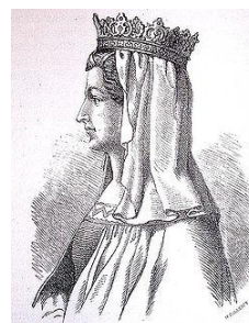
Margrethe I der bl.a. skabte Kalmarunionen

I dette eksempel er der taget udgangspunkt i fagene kristendomskundskab og historie, hvor der skal arbejdes med middelalderen. Jeg har valgt at sætte særligt fokus på religionsmøde og – konflikter, fordi de er en kilde til at forstå, hvad der foregår i vores samtid – væsentligst terrorhandlinger i øst og vest, Palæstina-konflikten og invasionen af Irak. Forudsætningen for at kunne forstå dette møde og disse konflikter er kendskab til to væsentlige kristne institutioner (klostrene og valfarten) samt udbredelsen i Europa af de andre to andre monotheistiske verdensreligioner, jødedom og islam. Forløbet har betydning i forhold til tre af kanonpunkterne for faget historie (Absalon, Reformationen og Columbus) og understøtter elevernes udviklings- og sammenhængsforståelse samt deres kronologiske overblik, som står centralt i formålet for faget. Samtidig arbejdes der med en både væsentlig og lang periode i kristendommens historier og forholdet mellem kristendommen og ikke-kristne religioner.