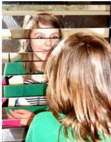
Udforskning af spejleffekter på Experimentarium